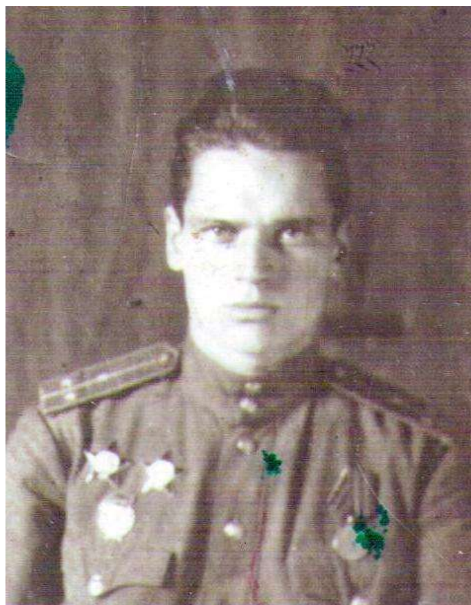
Тюленёв Иван Иванович. 1945 год.