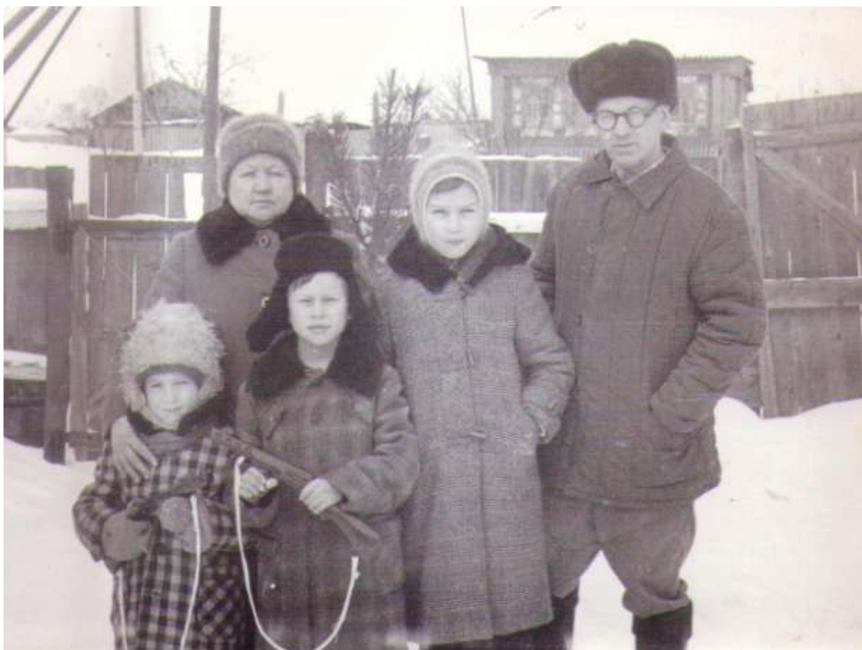
Тюленёвы с детьми